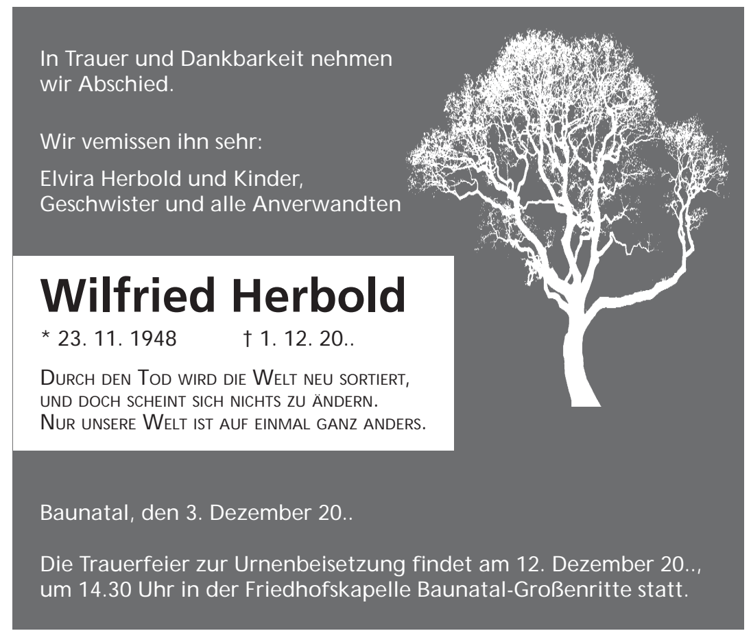
8/21 3-spaltig (141 mm breit) / 120 mm hoch, Berechnung: 360 mm Schrift: Frutiger, Symbol: trauer_baum03