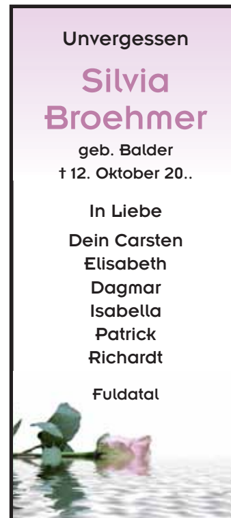
8/18 1-spaltig (45 mm) / 100 mm Berechnung: 100 mm Schrift: Insignia Symbol: trauer_rose03