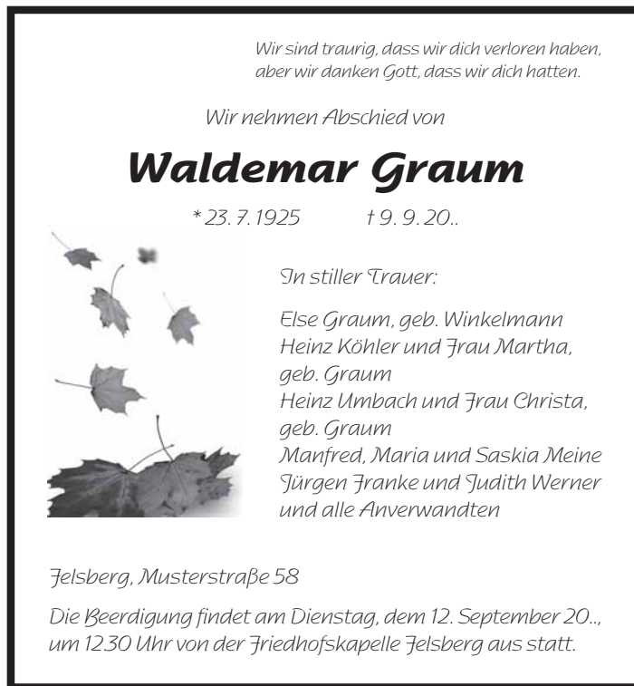
8/17 2-spaltig (93 mm breit) / 100 mm hoch, Berechnung: 200 mm Schrift: Nadianne, Symbol: trauer_blatt01b