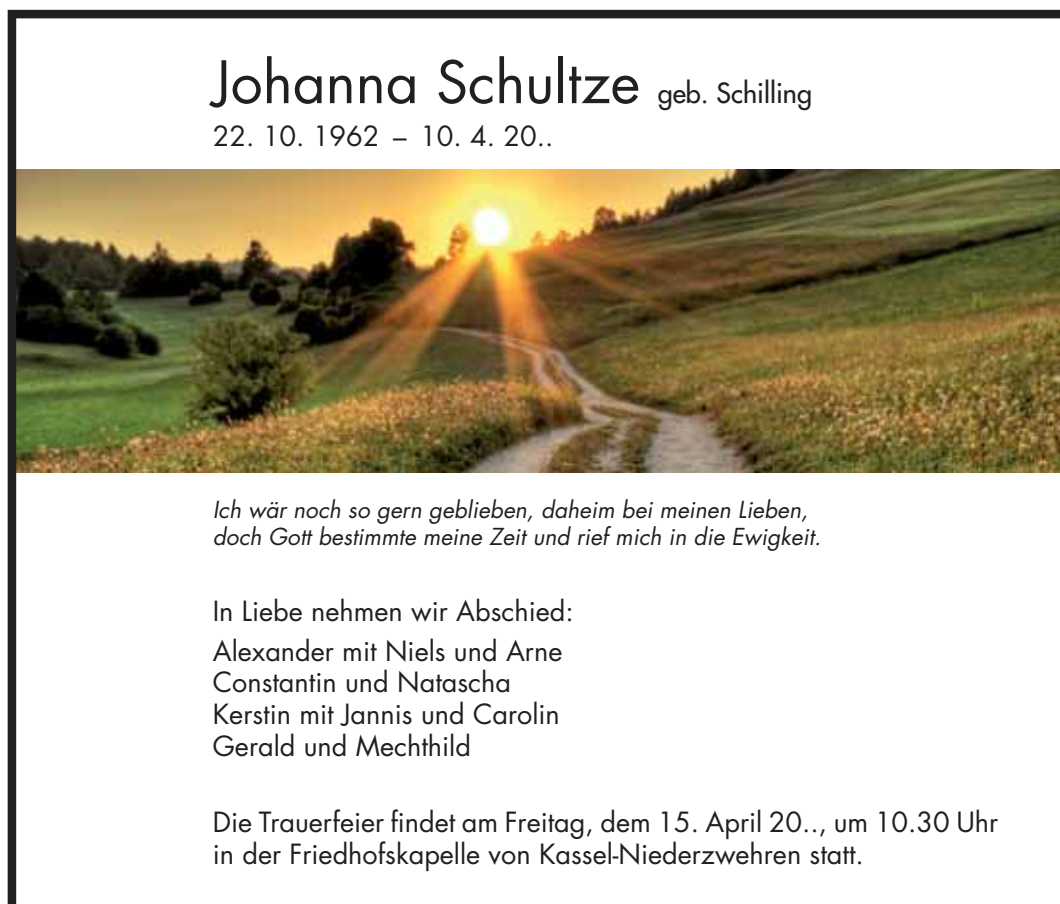
8/20 3-spaltig (141 mm breit) / 120 mm hoch, Berechnung: 360 mm Schrift: Futura, Symbol: trauer_hi_sonne02