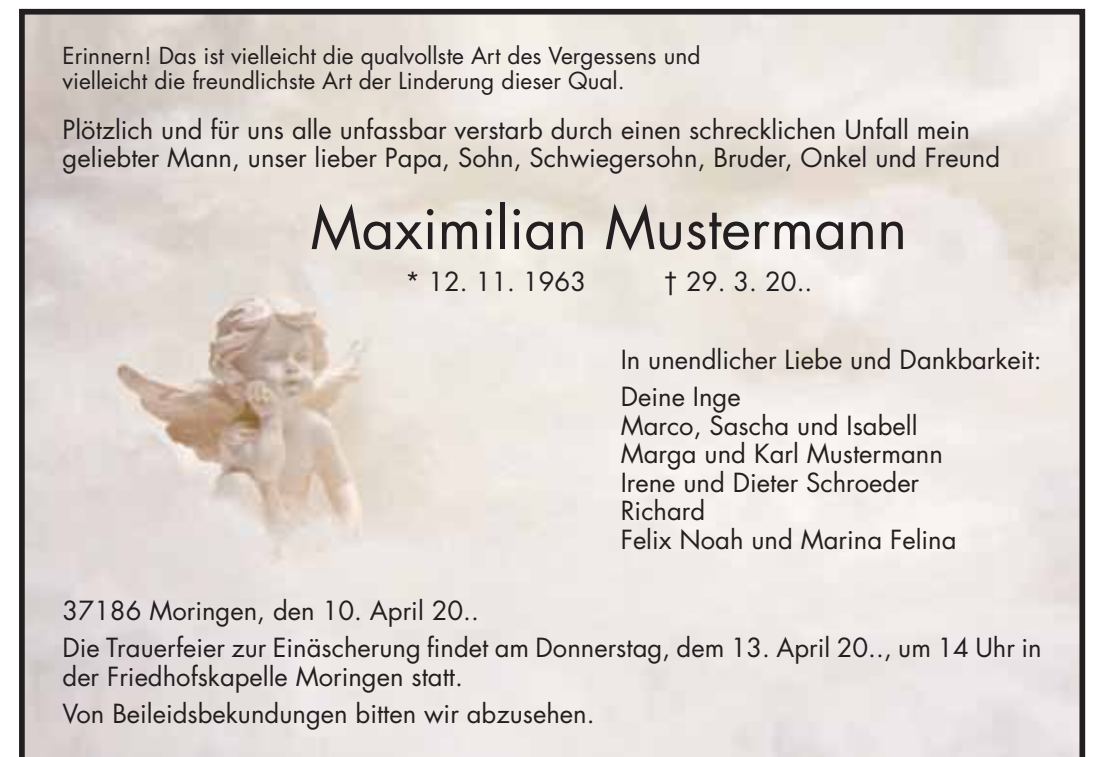
8/19 3-spaltig (141 mm breit) / 100 mm hoch, Berechnung: 300 mm Schrift: Futura, Symbol: trauer_hi_engel02